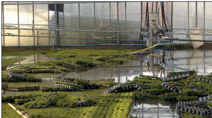
Photographie n° 1 : Dommages aux cultures sous serre après l'éclatement du réservoir d'eau situé derrière la paroi de la serre.

Ces derniers réservoirs d'eau sont disponibles dans différentes tailles et avec différents films de revêtement. Ils sont très polyvalents et appropriés pour les différentes qualités d'eau utilisées pour l'irrigation des cultures (eau de pluie, eau de drainage ou eau d'irrigation avec engrais). Le montage des silos d'eau est possible avec relativement peu d'effort et à moindre coût. L'eau stockée peut être protégée par des couvertures contre