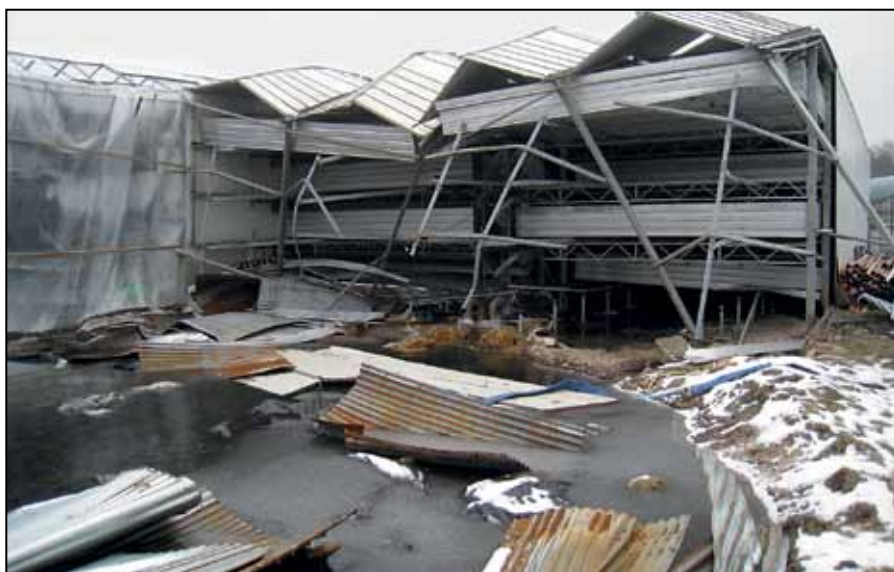
Photographie n° 2 : La vague générée par la rupture du réservoir a gravement endommagé la construction de serre Venlo.

Les réservoirs d'eau en plein air sont largement exposés au vent. Le fabricant impose donc d'enterrer, de butter ou de fixer avec des équerres la base du réservoir. Sinon, le vent peut