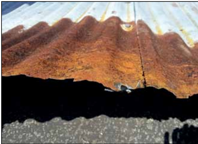
Photographie n° 3 : Rouille importante à l'intérieur des tôles ondulées déchirées

déplacer les réservoirs partiellement ou totalement vides de leur emplacement et les endommager.