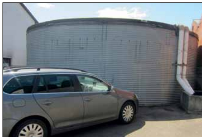
Photographie n° 5 : Sans protection contre les collisions, un incident peut vite survenir dans cette situation.

Les acides sont parfois utilisés dans certaines exploitations pour nettoyer et désinfecter les tables de cultures ou autres outils de production. Les équipements doivent être installés dans la mesure du possible de sorte