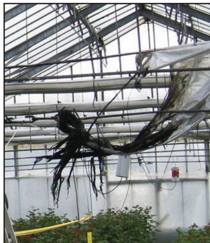
Image ci-dessus : un évaporateur à soufre a enflammé les écrans d'ombrage. Dans ce type de situation, Gartenbau-Versicherung recommande d'utiliser un écran difficilement inflammable et de respecter une distance suffisante avec les appareils.

Depuis leur mise sur le marché ces appareils ont été améliorés avec un réceptacle dont le bord recouvre celui du boîtier, réduisant le risque d'un débordement direct sur la lampe. Les appareils à lampe avec un réceptacle à soufre réglable en hauteur et un espace ouvert vers le haut entre la coupelle d'évaporation et le boîtier ne correspondent plus aux standards actuels et devraient être éliminés !