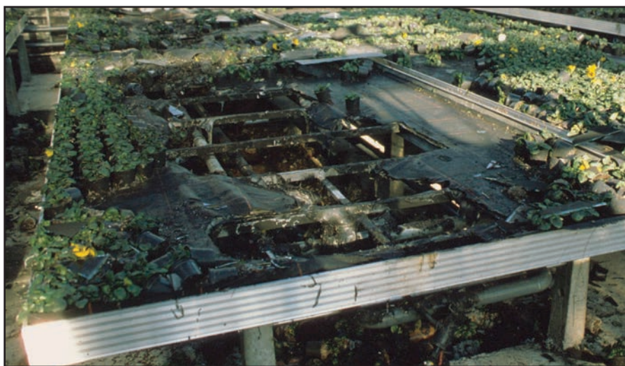
Image ci-dessus : des matériaux inflammables situés en dessous d'un évaporateur à soufre peuvent s'enflammer suite au débordement de l'appareil.