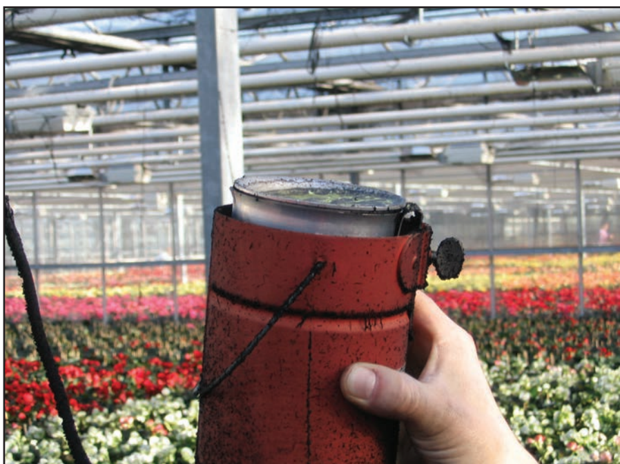
Image ci-dessous : un évaporateur à soufre trop rempli et/ou suspendu de travers peut déborder. Le soufre peut alors s'enflammer au contact de l'ampoule et provoquer un incendie.